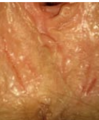
Fissuren aan het perineum

Ook een droge, intensieve reiniging, bijvoorbeeld na het plassen of ontlasten, en uitgebreid schoonvegen bij bijvoorbeeld druppelincontinentie of veelvuldige stoelgang met zachte ontlasting irriteren de gevoelige huid in de schaam- en anaalstreek en kunnen het huidoppervlak aantasten.