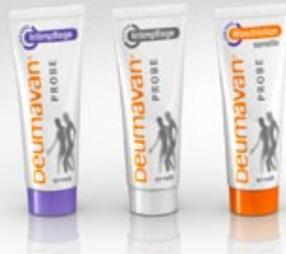
Monstertube zalf met lavendel